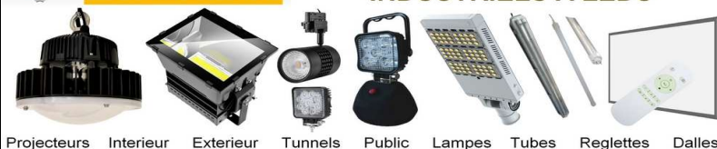
Projecteurs Interieur Extérieur Tunnels Public Lampes Tubes Reglettes Dalles

www.phocee-composants.fr phocee-composants@wanadoo.fr